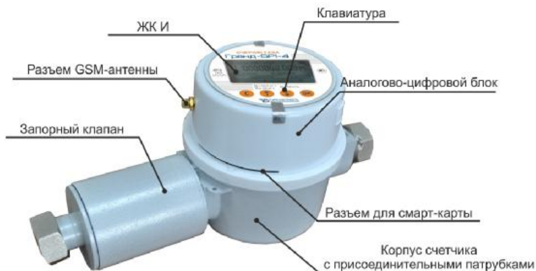
Рисунок 1 – Внешний вид счетчиков газа Гранд - SPI

Ввод параметров настройки в счетчики производится с помощью настроечной смарт-карты и/или при подключении к ПК с установленным специализированным программным обеспечением.